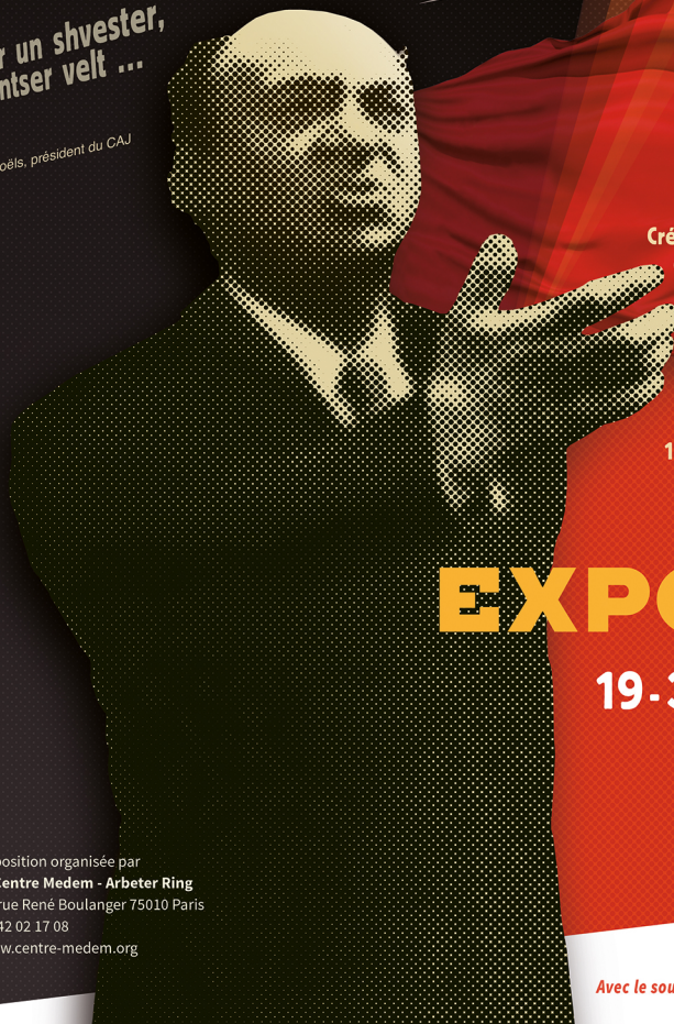
Photo : Solomon Mikhoëls, président du CAJ

Créé en URSS, en pleine guerre mondiale, le CAJ est à la fois un comité d'intellectuels juifs résistants, le terreau dans lequel la vie culturelle juive yiddish croit pouvoir se réaliser et, pour le pouvoir soviétique, un instrument de propagande vers l'Occident. Soumis en secret à une surveillance sévère, il est interdit en 1948. Son destin s'achève tragiquement le 12 août 1952, lors de la « nuit des poètes assassinés ».